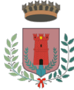
Comune di Poggio Mirteto